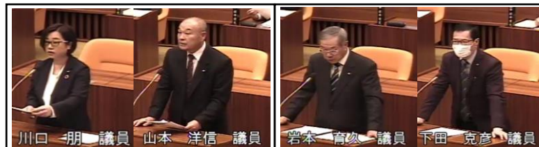
(2班) 代表質問 (1班)