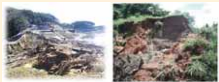
平成23年3月(福島県) 東日本大震災により決壊 平成26年8月(京都府) 豪雨により決壊

な大雨や地震などの自然災害が重なることにより、ため池が決壊し、人命や財産などに大きな被害をもたらす危険性が高まります。