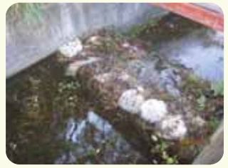
土のうによる洪水吐のかさ上げ